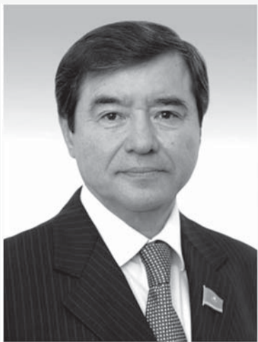
Асхат КУЗЕКОВ, депутат Сената Парламента Республики Казахстан