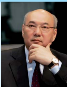
Бақытжан Жұмағұлов, ҚР Білім және ғылым министрі