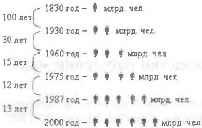
Рис. 1. Увеличение численности на миллиард.