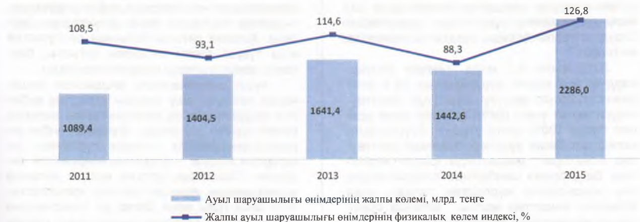
1-сурет. Ауыл шаруашылығының жалпы өнімдерін өндіру келемі