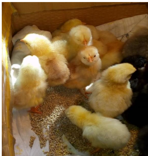
1-сурет – №1 тәжірибелік тобының балапандарын шығару

Зерттеудің үшінші тобы термоконтраст режимі қолданылған №2 тәжірибелі тобы болды. Жұмыртқа инкубациясының негізгі факторының әсері – температура, эмбриондардың дамуында үлкен маңызға ие. Мұны эмбрионның толық өсуі мен дамуында ғана емес, сонымен қатар жеке мүшелер жүйесінің дамуында да байқауға болады. Инкубацияның басында жоғары температураны мерзімді сақтау керек, өйткені дәл осы уақытта орташа көрсеткіштен жоғары температура эмбрионның дамуына оң әсер етеді. Жұмыртқаларды инкубациялау кезінде жоғары температураны үнемі қолдану дамудың бұзылуына әкелуі мүмкін, жұмыртқалардың қызып кетуіне әкеледі, жас жануарлардың шығуына және оның одан әрі өміршендігіне теріс әсер етеді. Эмбрионның қалыпты дамуы үшін қалыпты температура 39° құрайды.