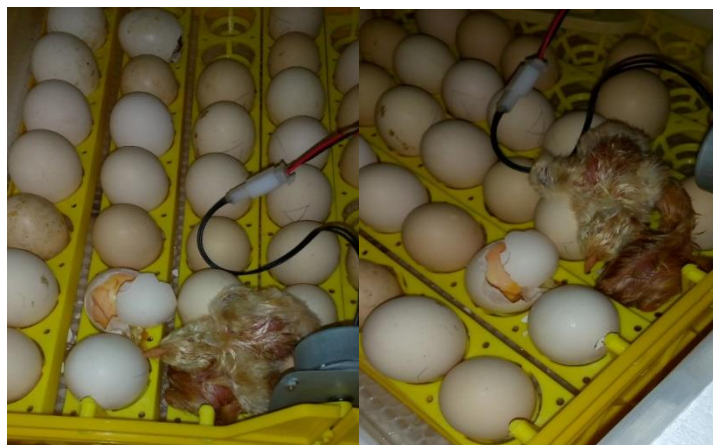
2-сурет – Балапан шығу

Октябрьское ауылының Тереңкөл ауданында «Брама» тұқымды тауықтардың жұмыртқаларын инкубациялау кезінде біз қолданған әдістер алғаш рет қолданылды