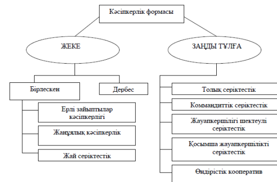
Сурет 2 – Кәсіпкерлік формалары

Шағын және орта кәсіпкерліктің субъектілері, 2-суретте көрсетілгендей, өзінің қызметін заңды тұлға құрмаған жеке кәсіпкер формасында заңды тұлға формасында жүзеге асырады.