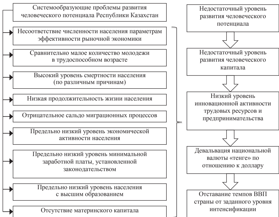
Рисунок 1 – Системообразующие проблемы формирования и развития человеческого потенциала и капитала Республики Казахстан