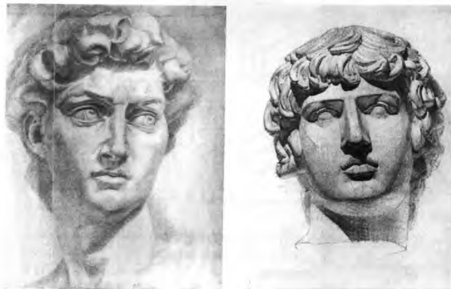
Рисунок 2 - Примеры экзаменационной работы по экзамену «Рисунок, живопись 2».