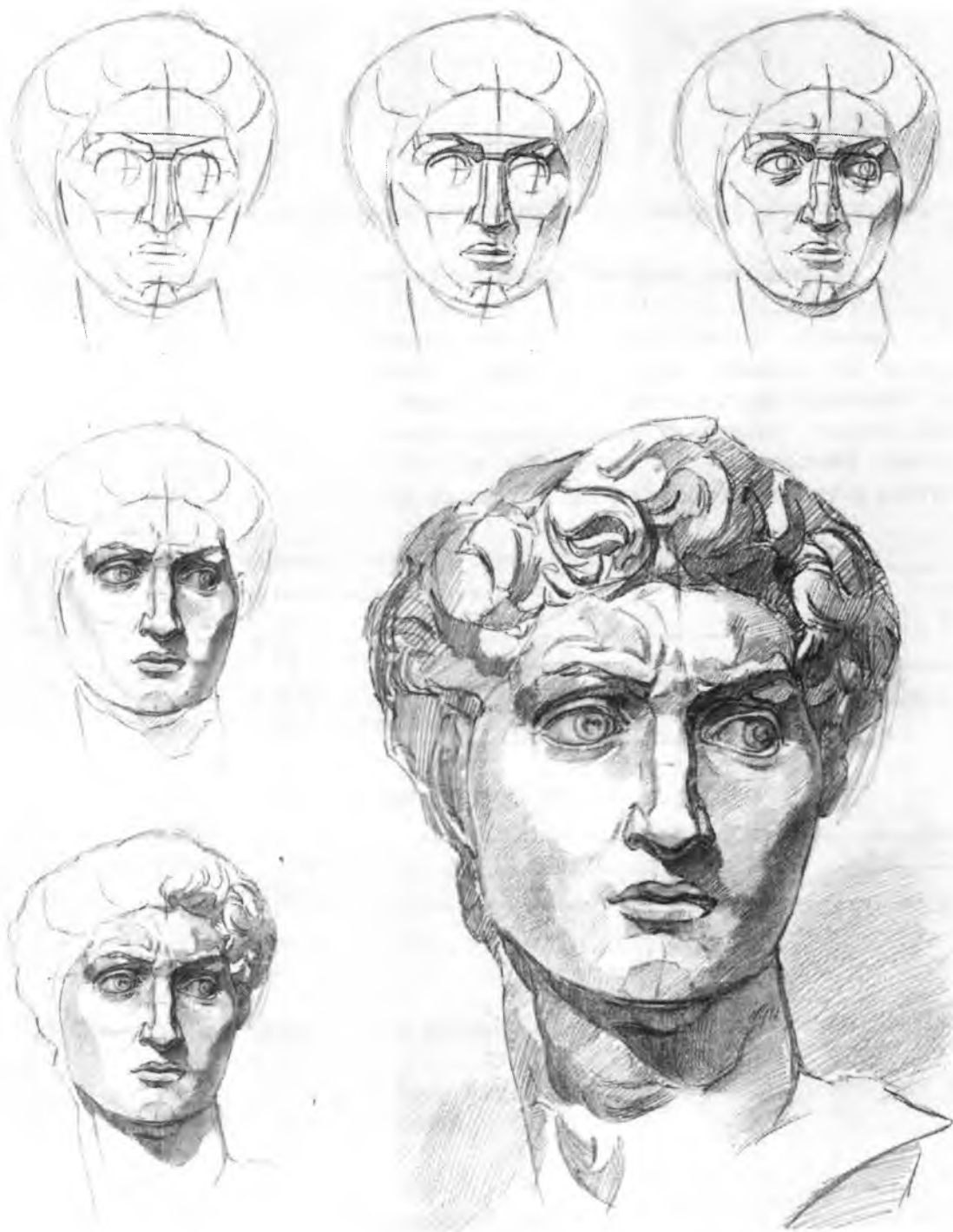
Рисунок 1 – Поэтапное выполнение рисунка

7 этап: тональная проработка. Самые выступающие места нос и лоб, затем скулы и подбородок – они освещены, глаза и щеки находятся в полутени. Падающие тени должны быть построены, то есть, увязаны с границами форм, их отбрасывающих. Завершающая стадия: уточнение тональных отношений и контрастов. В тоне нужно проверить, не путаются ли крупные отношения «свет – полутень – тень», проследить, чтобы рефлексы не спорили со светом. По мере удаления от зрителя и от источника света контрасты должны быть смягчены. Тени по краям нужно делать несколько слабее, чтобы связать с пространством листа.